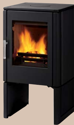
ASCUA Guss schwarz H900 x B480 x T516 mm