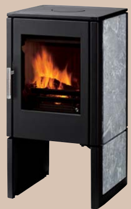
ASCUA Speckstein schwarz, mit Speckstein-Elementen H900 x B480 x T516 mm